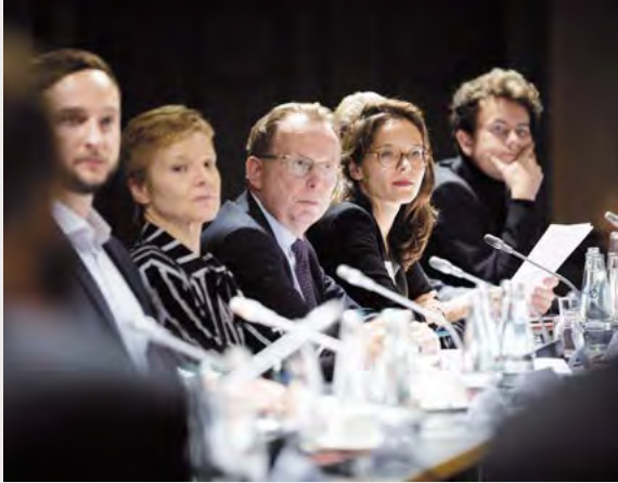
Genshagener Energiedialog 2018

des europäischen Binnenmarkts von entscheidender Bedeutung ist. Im Dezember 2017 führte die Stiftung anlässlich des zehnten Jahrestags der Osterweiterung des Schengenraums eine große öffentliche Podiumsdiskussion in der brandenburgischen Landesvertretung in Berlin durch, in deren Rahmen der Ministerpräsident und Kuratoriumsvorsitzende der Stiftung Dietmar Woidke eine insgesamt positive Bilanz der Schengenerweiterung zog. Es wurde aber auch deutlich, dass das Schengen-Europa der offenen Binnengrenzen nur dann eine Zukunft hat, wenn die Europäer in der Lage sind, durch gemeinsame Anstrengungen die Außengrenzen des Schengenraums wirksam zu schützen.