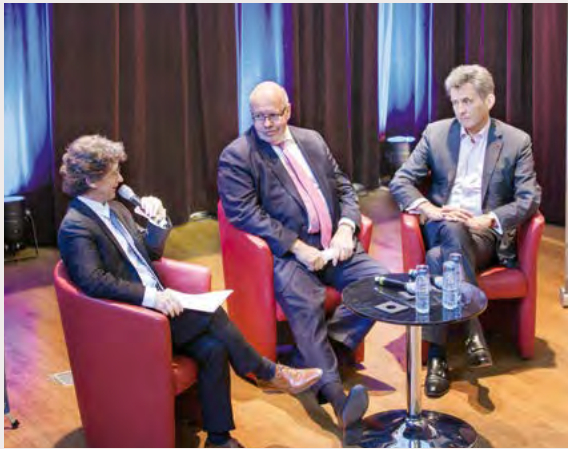
Peter Altmaier in Paris 2018