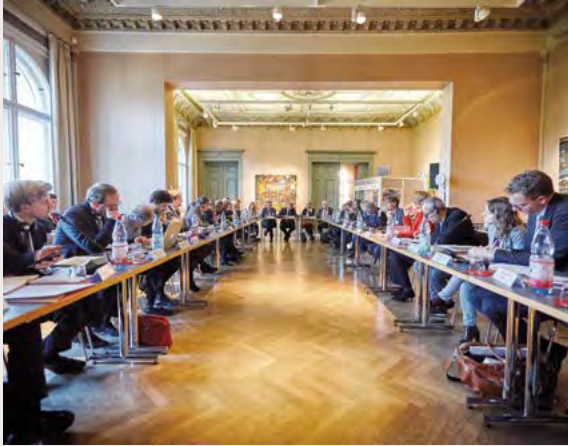
Initiative »Think Tanks Tandem« 2017

venten in allen EU-Staaten. Die Debatte ging von dem Grundgedanken aus, dass die Welle des autoritären Populismus, die längst auch Westeuropa erreicht hat, als Ausdruck einer generellen Krise der liberalen Demokratie interpretiert werden muss. Um das Vertrauen der Bürgerinnen und Bürger in die liberale Demokratie und das politische Projekt der europäischen Integration zurückzugewinnen, sind die politischen Verantwortungsträger in ganz Europa aufgerufen, einen offenen und respektvollen Dialog auf Augenhöhe mit den Bürgerinnen und Bürgern Europas zu führen.