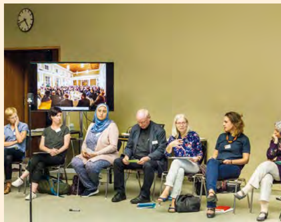
KIWit Kulturelle Gerechtigkeit im Kulturbetrieb im Haus der Kulturen der Welt

Seit 2012 zieht sich das Thema der Öffnung von Kunst- und Kulturinstitutionen als roter Faden durch die jährlich stattfindenden Treffen des »Netzwerks Kulturelle Bildung und Integration« in der Stiftung Genshagen. Die Idee für das 2012 gegründete Netzwerk ging aus dem Dialogforum »Kultur« im Rahmen des Nationalen Aktionsplans Integration der Jahre 2007 und 2012 hervor. Akteurinnen und Akteure aus dem Kulturbereich hatten sich auf ein strategisches Ziel verständigt: Kulturelle Pluralität leben – interkulturelle Kompetenz stärken.