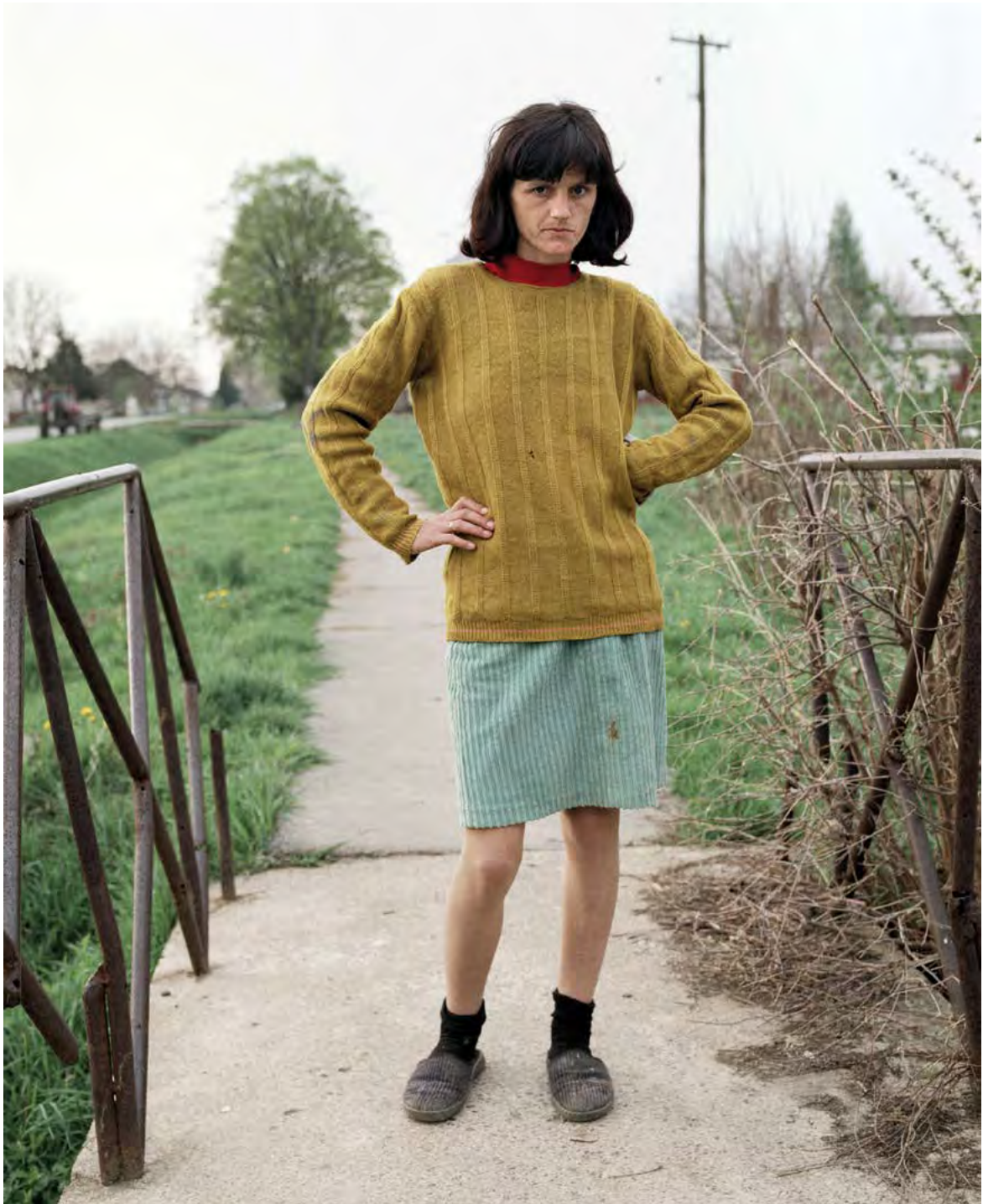
»Mirsana Baršić« Fotografie, 2003 – 2005