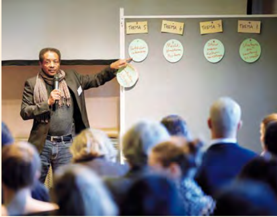
Netzwerk Kulturelle Bildung und Integration