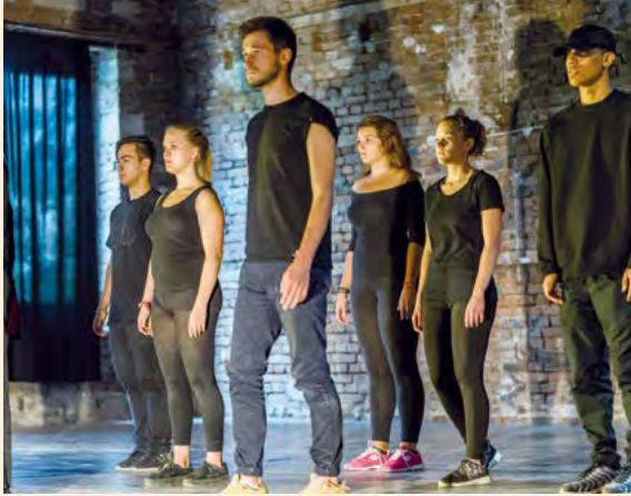
Nomadisches Labor im Rahmen des Projekts »An den Grenzen der Zukunft« in Ruse, Bulgarien

Ein weiteres Beispiel ist das mehrjährige Projekt »An den Grenzen der Zukunft«: Dort finden in »Nomadischen Laboren« internationale Jugendbegegnungen statt, die sich mit künstlerischen Mitteln einer gesellschaftlichen Fragestellung nähern und diese performativ umsetzen. Das Ergebnis wird im Rahmen einer europäischen Fachtagung präsentiert und diskutiert. 2017 trafen sich Jugendliche zwischen 17 und 24 Jahren aus Frankreich, Deutschland und Bulgarien im Rahmen des Tanz-, Theater- und Animationsfilm-Workshops in Ruse/Bulgarien und erarbeiteten gemeinsam unter dem Titel FLUX eine Performance zum Thema Migration: »Wir beobachten und sind Teil von Bewegungen – flux – und Migrationen in und durch Europa.« Polarisierende politische sowie