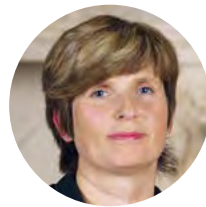
Viola Hetze Veranstaltungsservice