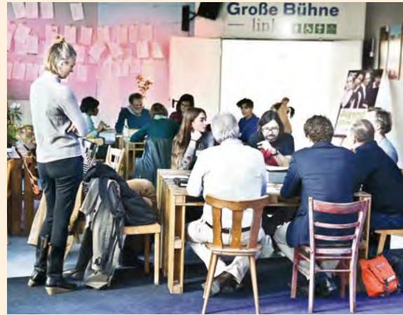
2. KIWiT-Denkwerkstatt im Jungen Schauspiel Düsseldorf

Nach insgesamt sechs Jahren der Netzwerkarbeit ist als besonders positive Entwicklung hervorzuheben, dass die thematischen Diskussionen mit jedem Netzwerktreffen immer konkreter und praxisorientierter wurden. Das zeugt davon, wie intensiv sich eine Vielzahl an Institutionen und weiteren Akteuren aus den Bereichen Kunst und Kultur im Prozess der Diversitätsentwicklung engagiert. Darüber hinaus ist ein wichtiges Signal, dass die Diversitätsentwicklung in Kulturinstitutionen nun offiziell im Koalitionsvertrag der gegenwärtigen Bundesregierung festgeschrieben ist. Darin heißt es: »Die vom Bund geförderten Kultureinrichtungen sollen das Ziel umfassender kultureller Teilhabe als Kern- und Querschnittsaufgabe in der Organisationsstruktur verankern und nach Möglichkeit in den Bereichen Gremien und Personal, Ansprache des Publikums, Programmgestaltung und Zugänglichkeit ihrer Angebote berücksichtigen«.