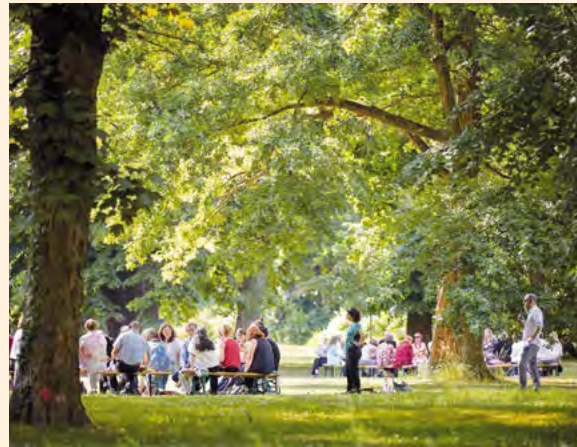
Akademie unter Bäumen 2018

Die Versuche der Einflussnahme auf die Kunst durch Rechtspopulisten stellen eine elementare Grundrechtsverletzung dar. Besonders besorgniserregend ist, dass Rechtspopulisten zunehmend den Diskurs diktieren, zum Maßstab für die Politik der anderen Parteien werden und somit die politische Kultur und die Gesellschaft insgesamt verändern. Die Abwehr solcher Bewegungen kann deshalb nicht nur Aufgabe der Politik sein, sondern ist eine gesamtgesellschaftliche Aufgabe, ein zivilisatorisches Projekt, an dem sich auch der Kunst- und Kul-