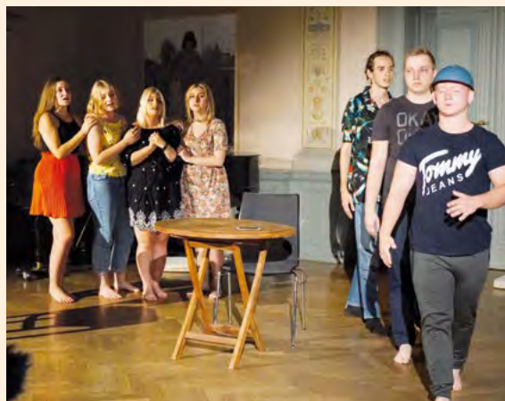
Theaterprojekt »100 Jahre nach dem Ersten Weltkrieg« 2018

2018 wurde an bedeutende historische Ereignisse in Europa erinnert, nicht zuletzt an das Ende des Ersten Weltkriegs vor 100 Jahren und an die Revolten von 1968 vor 50 Jahren. Der Kunst- und Kulturbereich der Stiftung Genshagen hat aus diesen Anlässen zwei Veranstaltungen zum Thema Erinnerungskultur in Europa organisiert, die Podiumsdiskussion »1968: Warschau – Berlin« in Zusammenarbeit mit dem Zentrum für Historische Forschung der Polnischen Akademie der Wissenschaften in Berlin im Juni 2018 sowie die Veranstaltung »Erinnerungskultur in Ost und West« in Zusammenarbeit mit der Deutschen Gesellschaft für Osteuropakunde e.V. im Rahmen der deutsch-französisch-polnischen Reihe »Der etwas andere Dialog« im Oktober 2018. Der Ausgangspunkt der Diskussionen war die Aufarbeitung der Geschichte, die für jedes Land eine Herausforderung darstellt. Erinnerung spielt in der Bildung der nationalen Identität jedes Landes eine wesentliche Rolle, daher wird sie überall von der Politik beeinflusst. Geschichtsinterpretationen führen dabei immer wieder zu Auseinandersetzungen – innerhalb eines Landes, aber natürlich auch mit den Nachbarn. Vor 1989 verlief der offizielle Diskurs in der Geschichtspolitik in Ost- und Westeuropa zum großen Teil ohne die Möglichkeit eines wirklichen, vertieften Austauschs miteinander. Daher gibt es im Verhältnis zwischen den ost- und westeuropäischen Ländern auf dem Feld