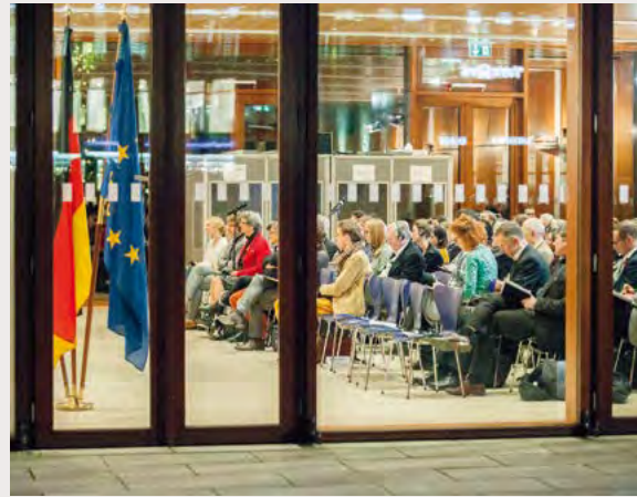
Podiumsdiskussion: Zehn Jahre nach der Osterweiterung des Schengenraums, 2017

und überlagerte das traditionelle Links-Rechts-Spektrum der europäischen Parteienlandschaft. Darüber hinaus ist dieses Gegensatzpaar auch zu einem prägenden Merkmal der internationalen Politik geworden. Der Trend zur Abschottung ist allgegenwärtig und kann als Reaktion auf politische, wirtschaftliche und kulturelle Entgrenzungsprozesse im Zuge der Globalisierung interpretiert werden. Politisch kommt er in einer zunehmenden Betonung der Rolle des Nationalstaats, in der Etablierung neuer und der Wiederherstellung alter, überwunden geglaubter Grenzen sowie in der Abkehr einzelner Länder von multilateralen Strukturen und Institutionen zum Ausdruck.