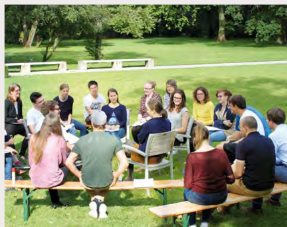
Genshagener Sommerschule 2017

Angesichts der vielfältigen Krisen mangelt es in der Debatte um die Zukunft Europas nicht an Kassandrarufern, die das Ende der europäischen Integration als politisches Projekt voraussagen. Die »Illusion Europa« sei an ihre politischen Grenzen geraten, so eine gängige Lesart der aktuellen Lage. Dies gelte sowohl im Hinblick auf die politische Handlungs- und Problemlösungsfähigkeit der EU als auch in Bezug auf Fragen der demokratischen Legitimität und politisch-kulturellen Identität in der EU.