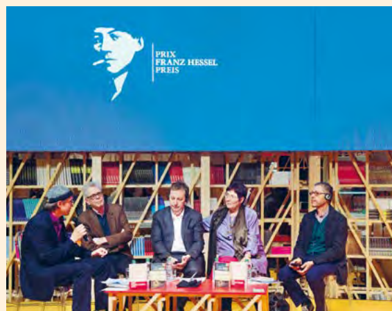
Präsentation des Franz-Hessel-Preises auf der Frankfurter Buchmesse 2017