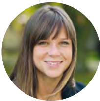
Alice Lorch Kommunikation