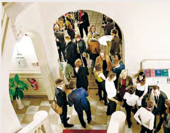
Europaforum Jugend und Demokratie 2017