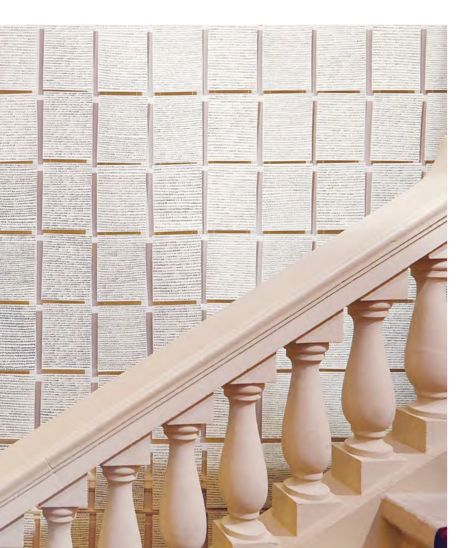
»306.000 Kreuze – Gedenken an 100 Jahre Schlacht um Verdun« 2016