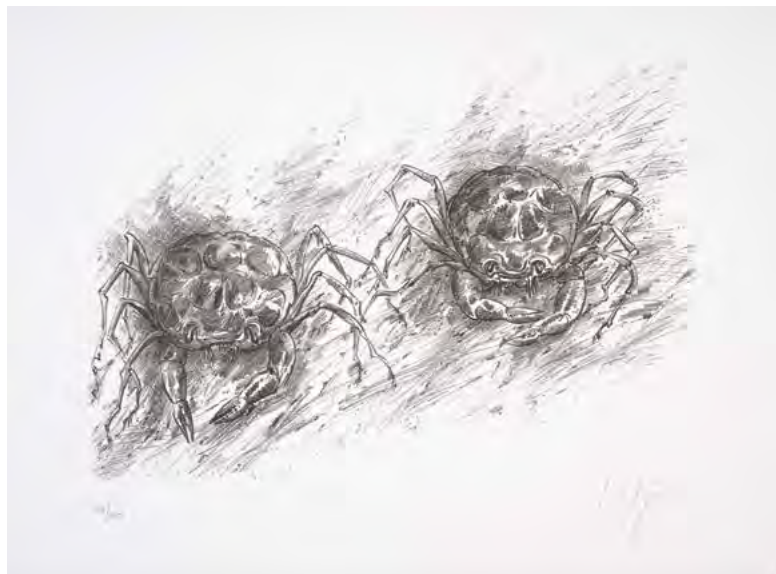
G. Grass, Sam w lesie; Selbst im Wald , litografia, 2008 G. Grass, Ciekawe czasy; Aufregende Zeiten , litografia G. Grass, Idąc rakiem; Im Krebsgang , litografia