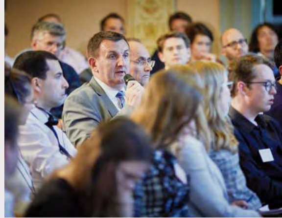
Genshagener Forum 2017

In den Jahren 2017 und 2018 konzentrierte sich die Arbeit des Europäischen Dialogs vorrangig auf die von Präsident Macron angestoßene neue große Debatte über die Zukunft der Europäischen Union (EU) und auf die damit eng verknüpfte Frage der Bürgerpartizipation in der EU. Nachdem das Jahr 2016 mit dem britischen Votum zum Brexit, dem Sieg von Donald Trump bei den US-Präsidentenwahlen und nicht zuletzt mit zunehmenden Polarisierungstendenzen in einer ganzen Reihe von EU-Mitgliedstaaten im Zuge der Migrationsdebatte als ein »annus horribilis« in die Geschichte eingegangen war, brachte das Jahr 2017 eine Reihe positiver Ereignisse mit sich, die Hoffnung für die weitere Entwicklung der europäischen Integration gaben.