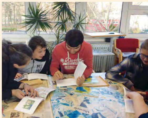
Märchenprojekt »Es war einmal... Erzähl mir (d)eine Geschichte!«

Die Perspektive von jungen Erwachsenen hat in unserer alternden Gesellschaft eine eher leise Stimme. Dieser Gehör zu verschaffen und sie gleichwertig in den Diskurs einzubeziehen, vor allem, wenn es um europäische Fragen geht, sehen wir in der Stiftung Genshagen als unsere Verantwortung. Dabei leitet uns die Überzeugung, dass eine selbst erfahrene Beteiligung an Projekten Kultureller Bildung oder die Möglichkeit, in partizipativen Seminarformaten Debatten mitzugestalten, auch den Wunsch nach Teilhabe an gesellschaftlichen Prozessen und an der Übernahme von Verantwortung fördert. Der Bereich »Kunst- und Kulturvermittlung in Europa« führt regelmäßig Pilotprojekte der Kulturellen Bildung durch. Dabei handelt es sich um Kooperationen mit Brandenburger Kultur- und Bildungsinstitutionen oder Vereinen. Unter der Leitung von Künstlerinnen und Künstlern werden – meist grenzüberschreitend – übertragbare Modellformate umgesetzt. 2017 entstand so in Kooperation mit der Gottfried-Daimler-Schule in Ludwigsfelde und Schülerinnen und Schülern einer Willkommensklasse ein Märchenbuch. Die Erzählung über ein